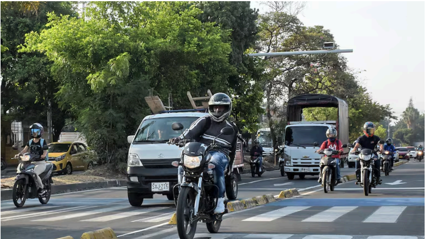
Sobre el carril del MÍO se han instalado cámaras de fotodetección.

En un año creció en 124 % el número de comparendos por cámaras de fotodetección.